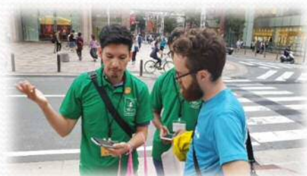
動く観光案内所外国人スタッフ

初のオンライン開催となりましたが、ネパール、インド、ベトナム、中国からの留学生在21名に参加していただきました。