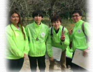
太宰府天満宮国籍調査の様子